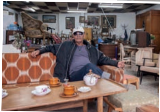
לוי. מנורות מתחילת המאה