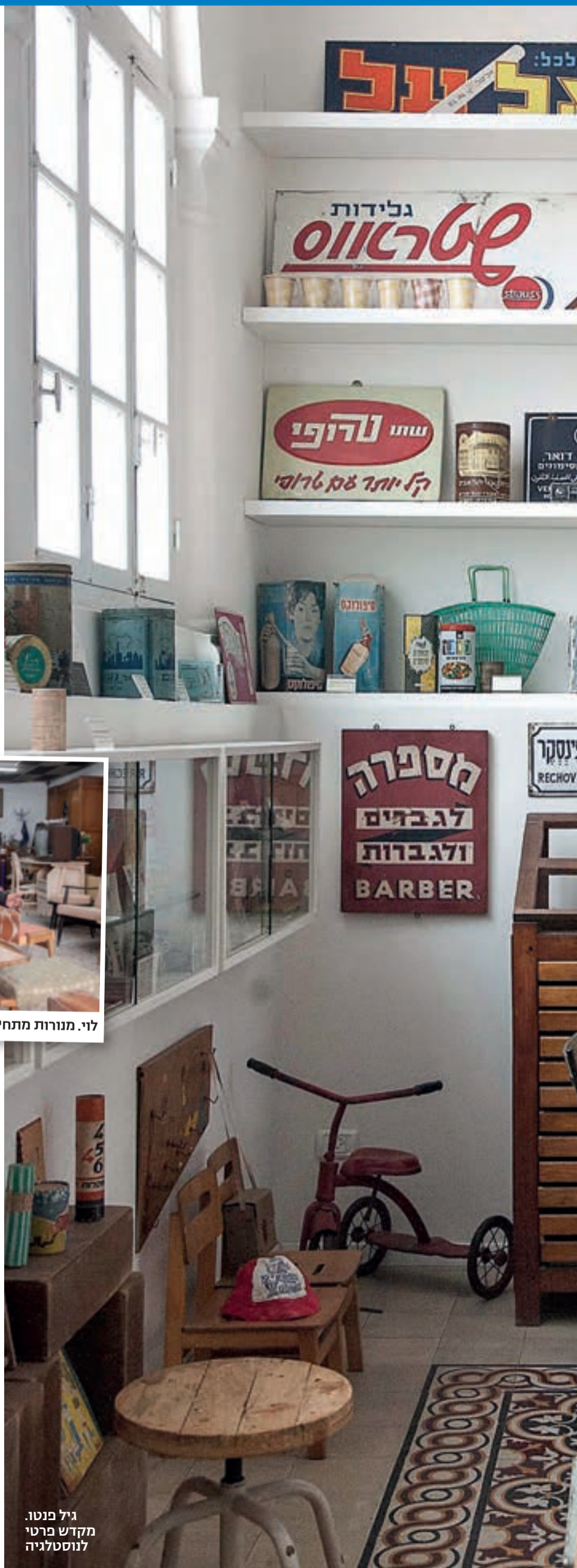
גיל פנטו. מקדש פרטי לנוסטלגיה

זיוה: "יכולים להגיד לי שאישה נפטרה. אני קודם חוקרת איפה היא הייתה קונה, איזה אדם היא הייתה, ואם אני מבינה שיש סטייל, אני הולכת ופותחת את הארון. אם יש 3-2 פריטים מרגשים, אני מתמקחת על כל הארון"