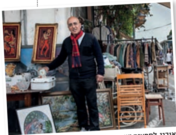
איבגי. לחפצים יש נשמה